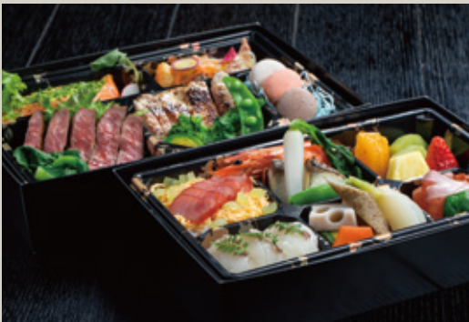
※和洋創作弁当 特選コース ¥5,400 (税込)